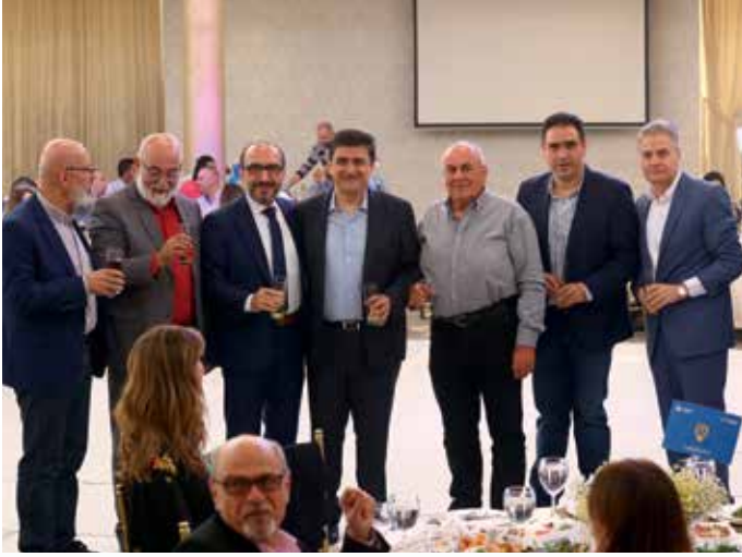
صورة جامعة لمدراء الشركة

بمناسبة عيد العمل، نظمت شركة أي بي تي في 28 نيسان اللقاء السنوي الجامع لموظفيها، وذلك في مطعم Orizon- جبيل. تخلل اللقاء تكريم باقة من الموظفين ومحطات ترفيهية تلتها أجواء موسيقية-غنائية مميزة ومفاجآت.