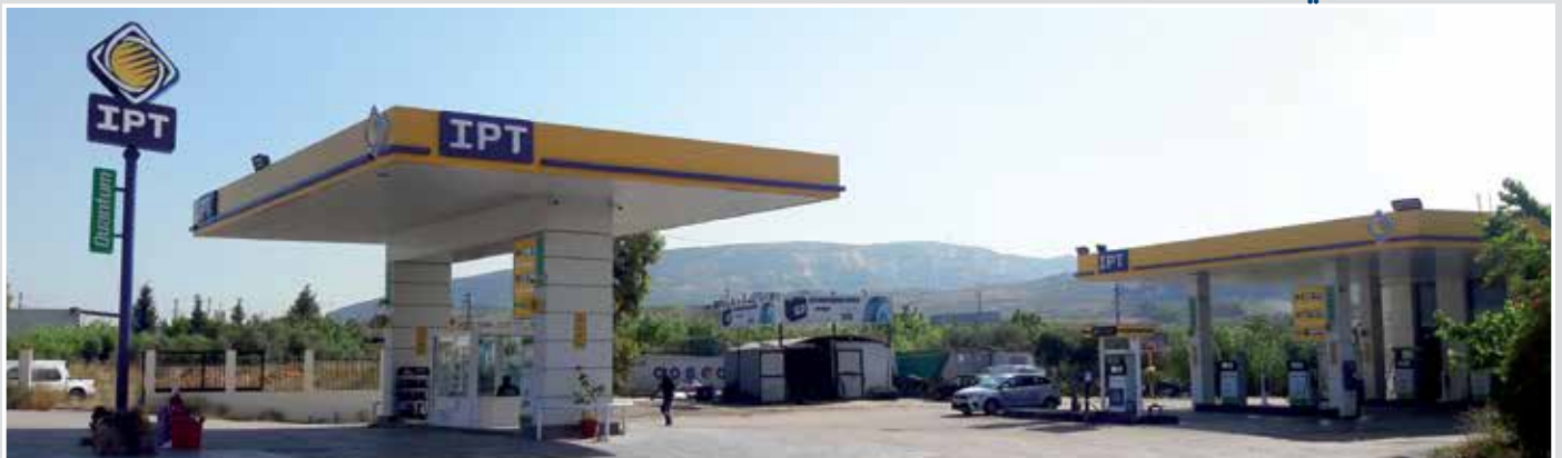
محطة أبي بدرا - شكا (البترون)، مجدّدة