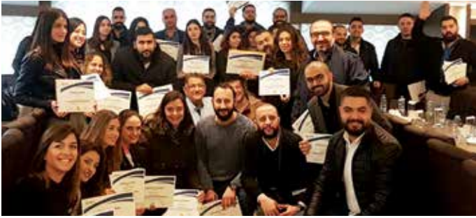
تسليم الشهادات للموظّفين