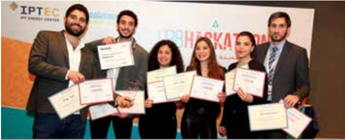
المركز الثاني "Hackollution" عن مشروع "Safayna"

ثلاثة أيام متواصلة في Berytech (مار روكز) تخلّتها ورش عمل، عروض، وفرصة لاستخدام FabLab لتصنيع النماذج الأولية عن المشاريع المبتكرة. النتيجة: 6 مشاريع نهائية تبارت أمام لجنة تحكيم دولية، احتلّ 4 منها المراكز الأولى: