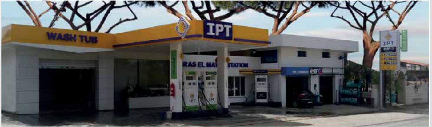
محطة راس المتن - راس المتن (بعيدا)

إنّ استقدام Quantum, البنزين العصري من أي بي تي واعتماده في السوق اللبنانية انعكس ثقةً إضافيةً بالمنتجات والخدمات التي تنفرد شركة أي بي تي بتقديمها. فقد تُرجمت هذه الثقة في أواخر العام المنصرم بقفزة نوعية وكَمّية للشركة وسرعة إنتشار غير مسبوقة لشبكة المحطات التي باتت تضمّ عشرات المحطات المنتشرة في كافة المناطق اللبنانية. في هذا السياق، تفخر أي بي تي بضمّ ثلاث محطات جديدة إلى شبكة المحطات، وتجديدها لعدّة محطات أخرى: