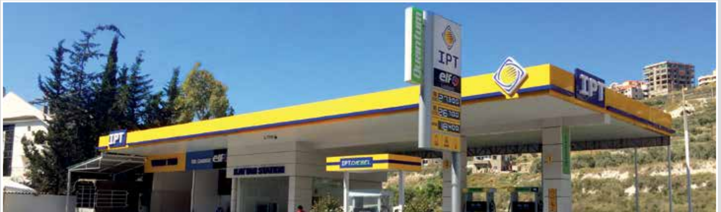
محطة قطنان - عين الدلب (صيدا)