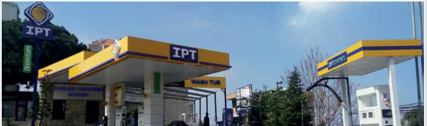
محطة كارلوس أبي ناضر - ذوق مكابيل (كسروان)