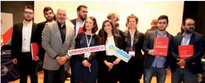
جائزة Universcience "SmartT" عن مشروع "SmartT App"