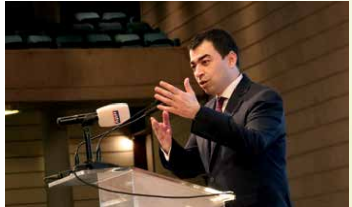
الوزير سيزار أبي خليل

يطلق برنامج الأمم المتحدة الإنمائي ومركز أي بي تي للطاقة مشروع منح "جوائز الوعي حول الطاقة" بهدف تعزيز مفهوم الإستهلاك المُستدام لمصادر الطاقة وإبراز الجهود المبذولة من قبل المؤسسات والمنظمات بهدف خفض وطأة استهلاك الطاقة وتشجيع اعتماد إجراءات بنويّة داخل هذه المؤسسات والمنظمات في مجال استدامة الطاقة، علماً أنّ هذه المبادرات تساهم في خفض تلوث الهواء على المستوى المحلي وفي حسن الأداء البيئي من خلال الحدّ من انبعاثات الغازات الدفيئة التي تؤدي إلى الاحتباس الحراري وتغيّر المناخ.