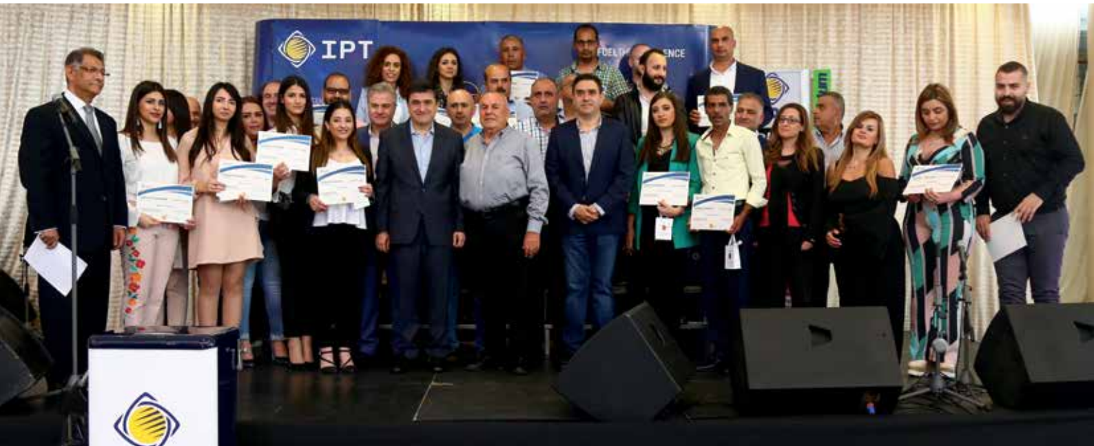
صورة جامعة للموظفين المكتمين والمتفوقين لعام ٢٠١٧ - ٢٠١٨