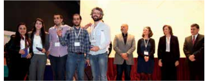
المركز الأول "Beirut Rah Tondaf – Detox Beirut" عن مشروع "Smarter Bus"