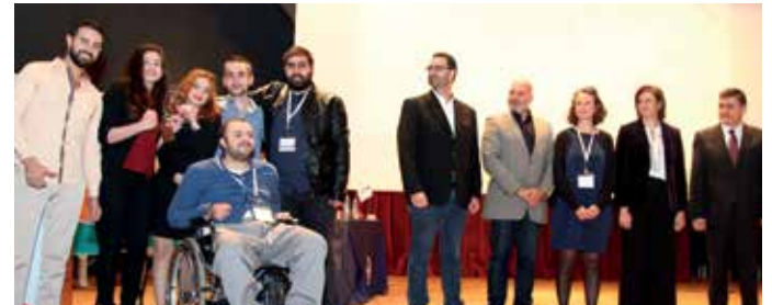
المركز الثالث "Breathe" عن مشروع "Breathe App"